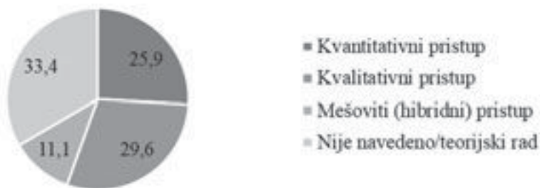
Grafikon 4. Način prikupljanja podataka u radovima koji su se bavili istraživanjem/promišljanjem pandemije, u %