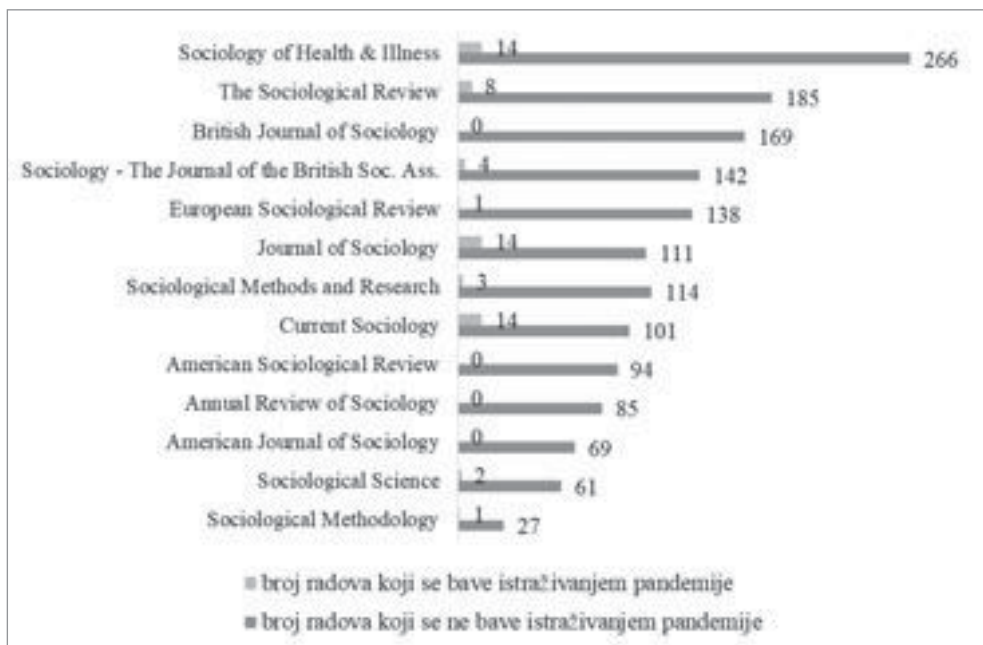
Grafikon 2. Ukupan broj objavljenih radova i broj radova koji se bave istraživanjem pandemije, prema časopisima

Ukoliko pogledamo radove koji se bave istraživanjem pandemije, najviše ih je objavljeno u pomenutom Sociology of Health & Illness (Wiley-Blackwell), kao i u Journal of Sociology (SAGE publications / The Australian Sociological Association), te Current Sociology (US / International Sociological Association) – po 14 radova u svakom od navedenih časopisa. No, treba imati na umu da su poslednja dva časopisa imala posebne brojeve posvećene pandemiji. Slede britanski časopisi The Sociological Review i Sociology s osam odnosno četiri rada, dok su časopisi koji se bave metodologijom objavili tek ukupno četiri rada (videti Grafikon 2). Pritom, bitno je primetiti da dva časopisa koja su najbolje rangirana ( American Sociological Review i Annual Review of Sociology ) nisu objavila nijedan rad koji se bavi istraživanjem pandemije i njenih posledica.