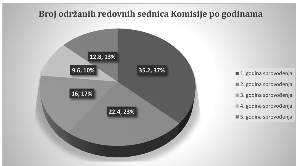
Grafikon 1: Broj održanih redovnih sednica Komisije po godinama

Kada je reč o metodologiji rada Komisije, značajno je napomenuti da je njena uloga u kompletnom petogodišnjem periodu bila ograničena isključivo na monitoring ali ne i na evaluaciju sprovođenja NSRP 2013-2018. Naime, mehanizam rada Komisije sastojao se u razmatranju kvartalnih izveštaja institucija nadležnih za sprovođenje NSRP 2013-2018. a potom i njihovom usvajanju. Ovaj proces, osim u retkim situacijama, uglavnom vezanim za prvu godinu sprovođenja Strategije, uglavnom se svodio na predstavljanje (čitanje) izveštaja institucija, nakon čega bi usledilo glasanje. Suštinska analiza postignutih rezultata mahom je izostajala i sprovedena je u dva navrata - prilikom pripreme revizije Akcionog plana za NSRP 2013-2018. i to u proleće 2014. i jesen 2015. godine. Nedostatak učestalije, periodične evaluacije, onemogućavao je i realizaciju značajne uloge koju bi Komisija trebalo da ima u pogledu uočavanja zastoja u reformama i njihovom usmeravanju.