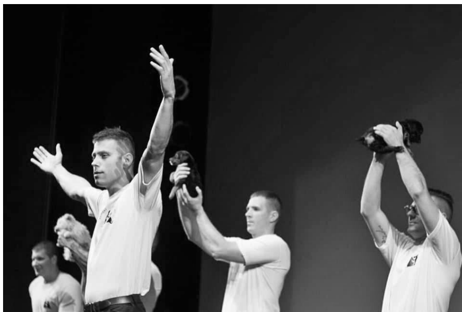
Fotografija 3: Premijera dokumentarnog filma “Komanda ljubav“, Dom omladine Beograda, 14.03.2019.