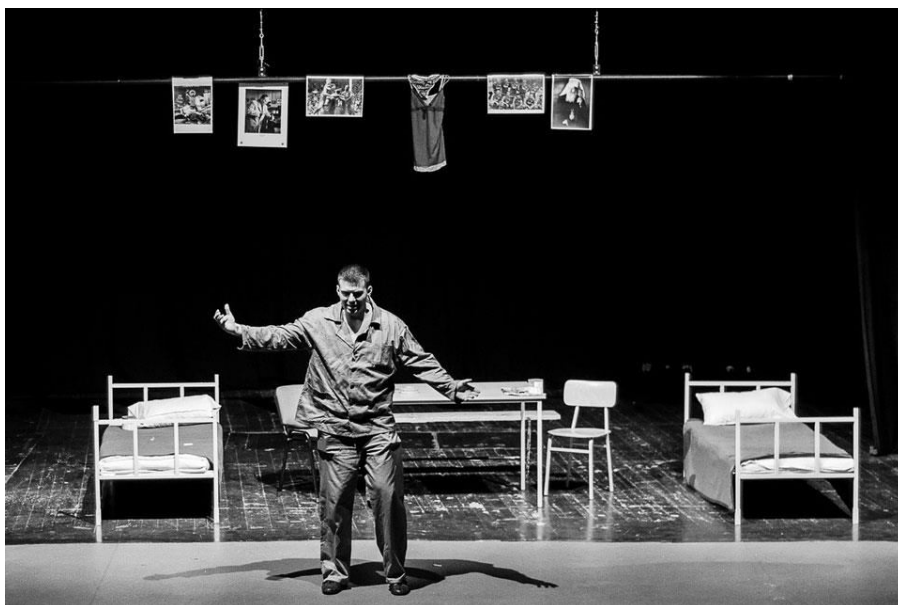
Fotografija 1: Pozorišna predstava “Zapisi iz ćelije broj 12”, Dom omladine Beograda, 07.09.2015.