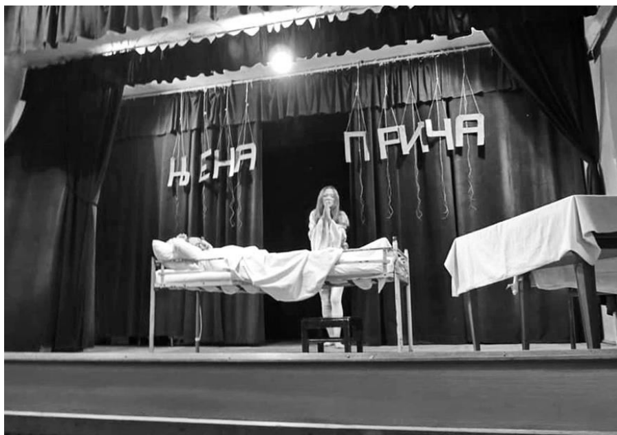
Fotografija 2: Pozorišna predstava “Njena priča”, Kazneno-popravni zavod za žene u Požarevcu, 26. 12. 2018.

I na ostale osuđenice učestvovanje u samom procesu pripremanja i izvođenja predstave, delovalo je oslobađajuće, pomagavši im da prevaziđu inicijalnu tremu i stid zbog pojavljivanja pred zajednicom nakon onoga što su učinile i da se oseće prihvaćeno i osnaženo. U tom smislu, “Njena priča” osobito naglašava princip reintegrativnog postidiivanja, kao jednog od najznačajnijih elemenata restorativnog procesa, ali, svakako i ostale njegove principe, kao što je osnaživanje, praštanje...