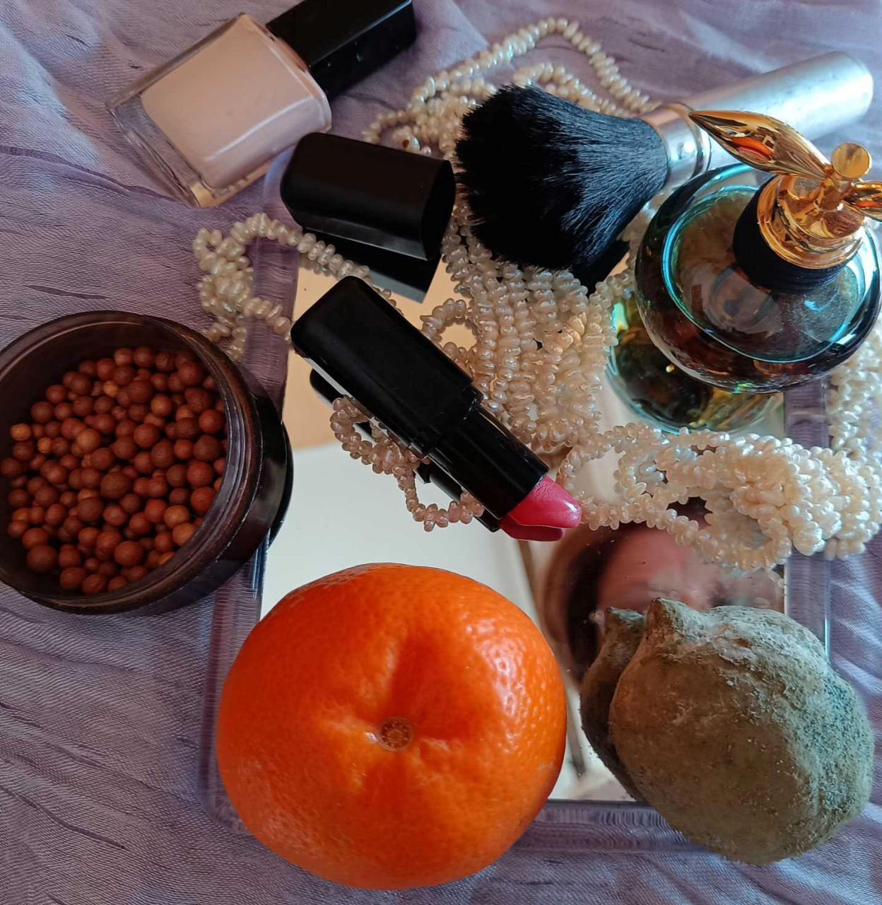
Fotografija br. 4. Zorica Kubiček, Lepota i zdravlje, Beograd, 2025.

„Svi mi mislimo o lepoti i zakazujemo kod frizera, pedikira i manikira, a niko ne misli da zakaže preglede i dok tako čekamo, desi nam se onaj limun tamo. Dok smo posvećeni trivijalnim i nebitnim stvarima, vreme prolazi. To je poruka koju mi i inače šaljemo kao udruženje: 'Pregledaj se na vreme, vodi računa o zdravlju.' To se ne vidi, ali kad dođe trenutak, onda se vidi.“