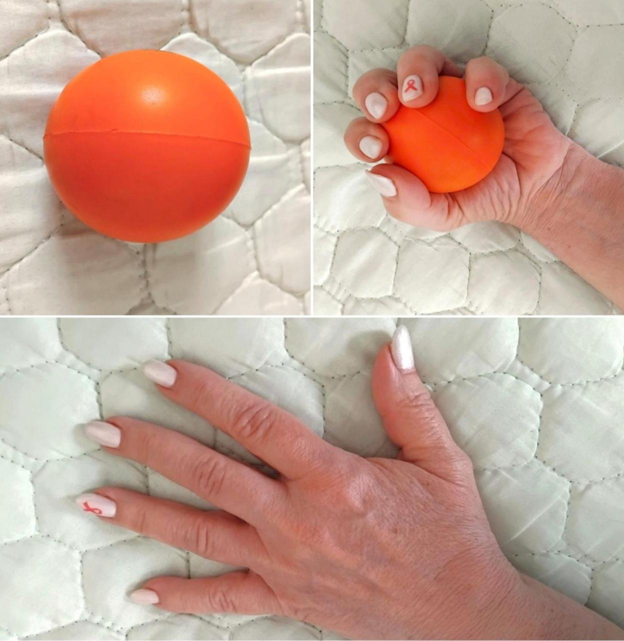
Fotografija br 1. Domina Spasić, Loptica za oporavak, Beograd, 2025.

„Loptica je iz tog perioda. Vežbanjem sam uspela da sačuvam ruku-funkcionalna je i nema otoka. Prošle su 22 godine od moje operacije. Mnogo toga je iza mene i u meni. Ispunjava me da prenosim svoje iskustvo i pomažem ženama da lakše prebrode strahove koje svi imamo na početku lečenja i koje učimo da držimo pod kontrolom. Strah ne možemo potpuno izbeći, ali je bitno da on ne vlada nama.“