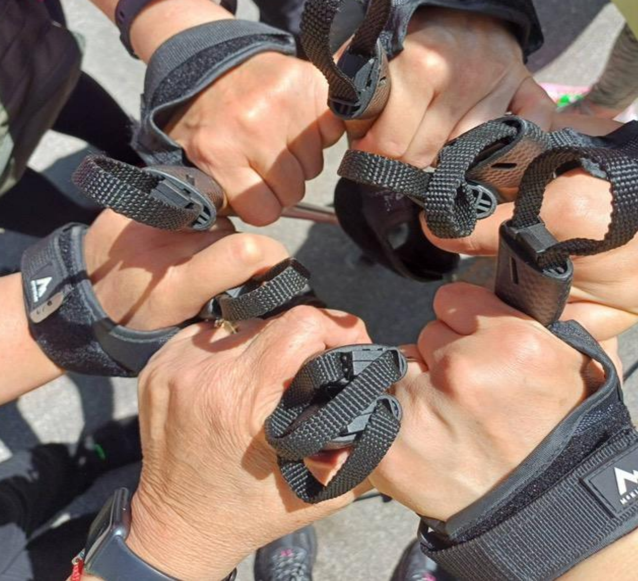
Fotografija br. 10. Snežana Lakušić, Zajedništvo i snaga Pink dama, Beč, 2025.

„Nikada se nisam bavila sportom jer sam imala puno zdravstvenih problema. Počela sam da treniram nakon operacije raka dojke i sada sam aktivna u više sportova. Tu sam se pronašla, što govori o tome da nikada nije kasno da se čovek ostvari u onome za čim je oduvek žudeo. Prošle godine sam krenula da treniram nordijsko hodanje i ovo mi je 5. medalja u tom sportu. Ovo su ruke pink dama. To su žene koje su operisane kao i ja. Nas 6 je krenulo u ovu avanturu. Trka je bila u Beču i posvećena je ženama. Učestvovalo je nas 28 hiljada žena iz 105 nacija. Slika sa našim štapovima pokazuje zajedništvo i snagu.“