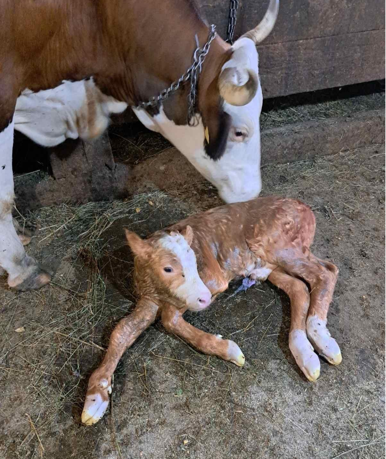
Fotografija br. 51. Rada Maksimović, Majčinska ljubav, Karaula, Romanija, 2025.