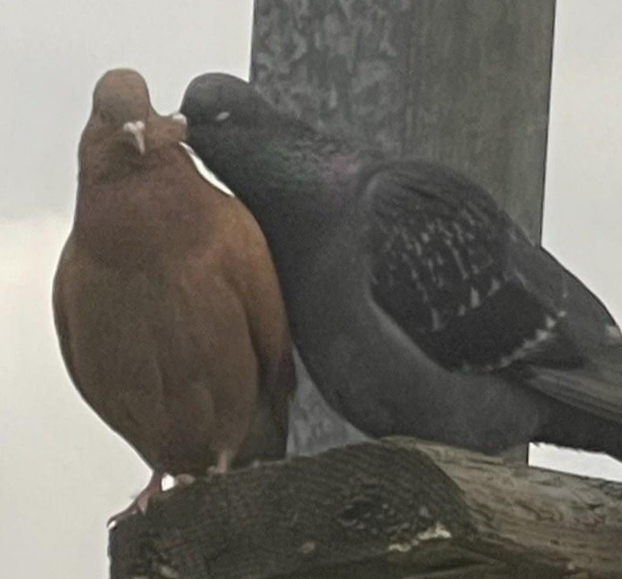
Fotografija br. 19. Domina Spasić, Tamo gde je ljubav, Beograd, 2025.

„Gledala sam ih i pratila šta rade sa prozora svoje kancelarije. Najpre su otišli, pa se odvojili, pa se opet spojili. To me je asociralo na ono što zovemo sigurnost, na moje sigurno mesto. Da je ljubav osnov svega. Kako ptice imaju ovde svoju ljubav, tako imamo i mi. To je ono što nas, bar mene, a mislim većinu nas, drži. Najveći oslonac - ljubav, a samim tim i sigurnost nalazim u okviru svoje porodice. Isto tako, gde god ima ljubavi, gde god se ona ispoljava, tu se osećam sigurno.“