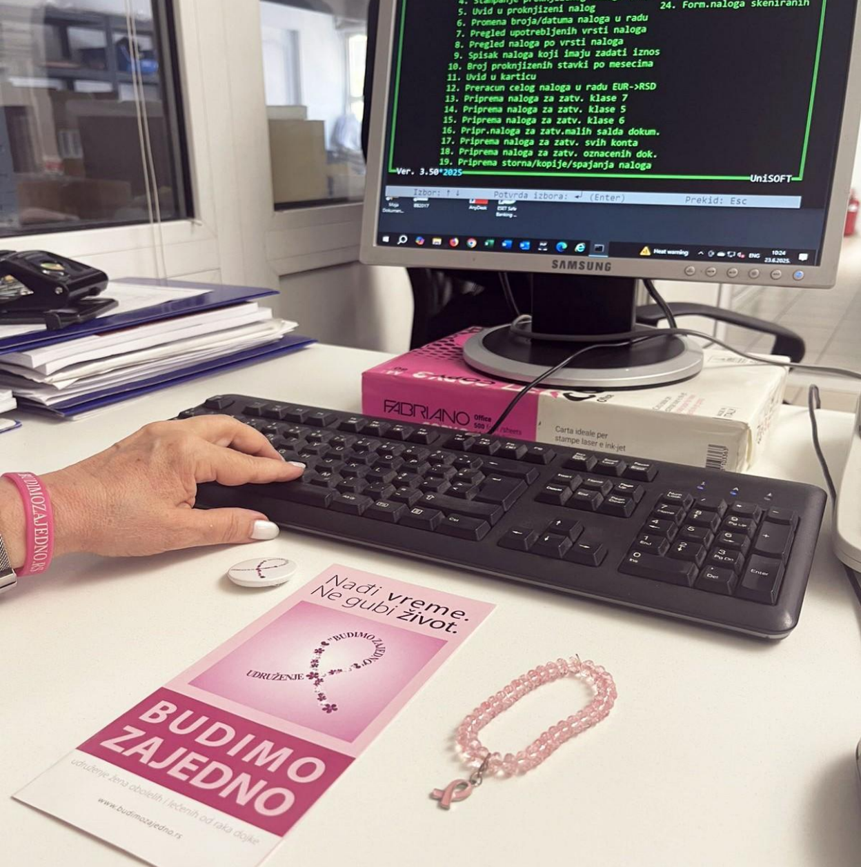
Fotografija br. 40. Domina Spasić, Ljubav prema poslu i humanitarnom radu, Beograd, 2025.

„Moje velike ljubavi i zadovoljstva su i moj posao, ali i humanitarni rad i druženje u Udrugu. Zajedno čine da se u celini osećam dobro i ispunjeno. Koliko drugima doprinosim humanitarnim radom, toliko se i meni vraća, kroz naša druženja i aktivnosti, kroz sve ove godine. To meni prija. Zato tako i radim.“