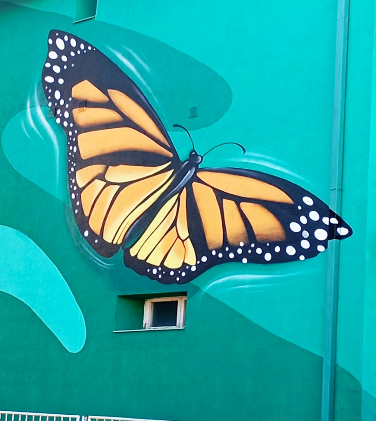
Fotografija br. 35. Lidija Petrović, Šta mi oboji dan, Beograd, 2025.

„Male radosti su dovoljne da mi osveže dan. Leptirić je detalj na jednoj kući pored koje svakodnevno prolazim. Fasciniraju me njegove lepe i jake boje i zato ga uvek pogledam.“